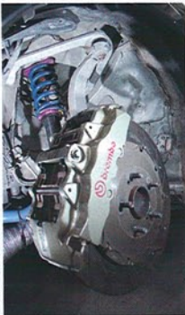
車高調は、クァンタムをベースにガレージ4413で独自の味付けをしたもの。素人にはちょっと乗りにくいかもしれないが、ドライバーのコントロールしたいで速く走れる「ドライバーを育てる足」といえる。

Z4413の足まわりのノウハウをパワーのあるクルマでどう生かせるかという試みになっている。もともとはドラッグ仕様とはいえず、極端な仕様というわけではなく、別のステージでもちよつとの変更で楽しめる、受けの広いチューンドといえるだろう。