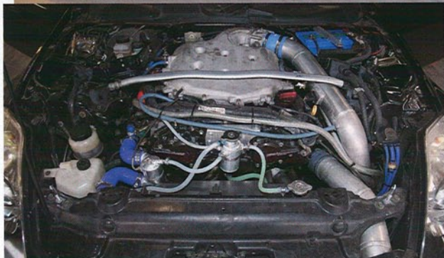
タービンは「装着可能な中でもっとも大きいものを」ということで、T04Zをチョイス。シリンダーヘッドには連続可変バルタイに対応するVカムを装着し、低速トルクを確保している。