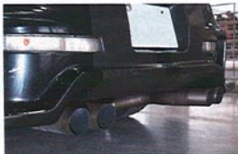
ガレージトータルが得意とするオリジナルワノンオフマフラー。個性的なチタン製の4本出しは、チューニングカーらしいカッコよさを意識してデザインしたという。

もともとはドラッグ仕様としてチューニングされたZ33を、サーキットアタック仕様にリメイクして持ち込んだガレージトータル。そこには、ドラッグ仕様でどこまでサーキットに通用するのかを試す、という狙いがある。エンジンはVQ35の持つ高トルク特性を生かしつつ、ターボ化することで500ps以上のハイパワーをマーク。しかし、それよりも注目してもらいたいのが目回りだ。