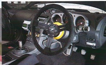
コンソールには、Fコナビゲーター、バルコン、EVCとサーキットアタックカウンター、さらにFコンVプロと空燃比計が装着されている。ステアリングの右側にあるのはウォータースプレーのコントローラーだ。