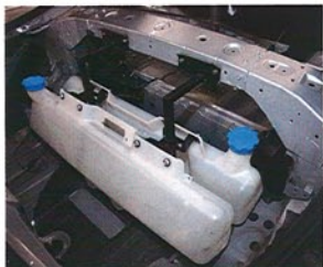
トランクルームにはSTIのスパル専用ウォータータンクを2基搭載。これで冷却系パーツにスプレーを噴き、周回時にも熱ダレなどを防ぐ。